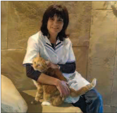
Ce petit chat roux a passé deux semaines de vacances à la pension du Chat doré, à Bernwiller.