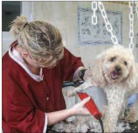
À la demande des maîtres, les animaux peuvent être tondus, lavés et peignés pendant le séjour.