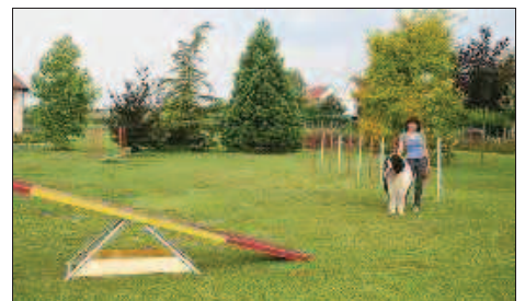
L'espace « agility » où les chiens viennent se défouler avec Pascale le matin.