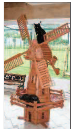
Chaque aile du château abrite un quartier hollandais, avec son moulin.