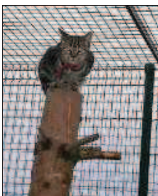
Les chats aiment prendre de la hauteur.