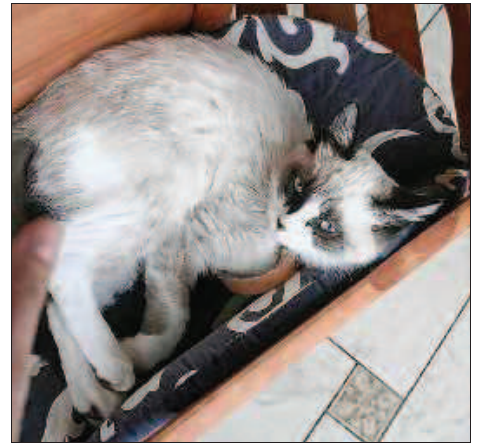
La vie est insupportable au club de vacances pour animaux à Bernwiller. Il n'y a qu'à regarder ce chat pour le comprendre.