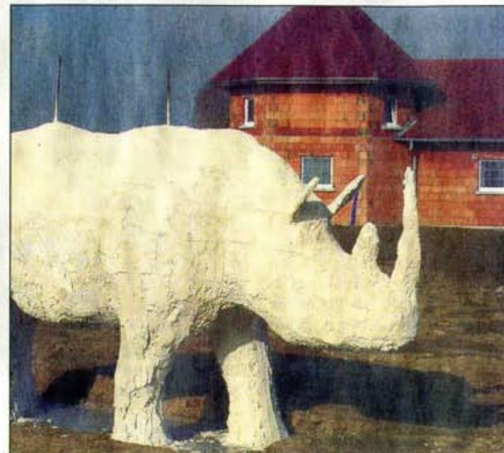
Un rhinocéros de trois tonnes est installé devant le Château du chat doré, à Bernwiller.

Les petites bêtes à poil pourront passer des vacances en toute quiétude au Château du chat doré, à Bernwiller. En effet, un gigantesque rhinocéros veille désormais sur la bâtisse et défie les intrus d'oser pénétrer la propriété.